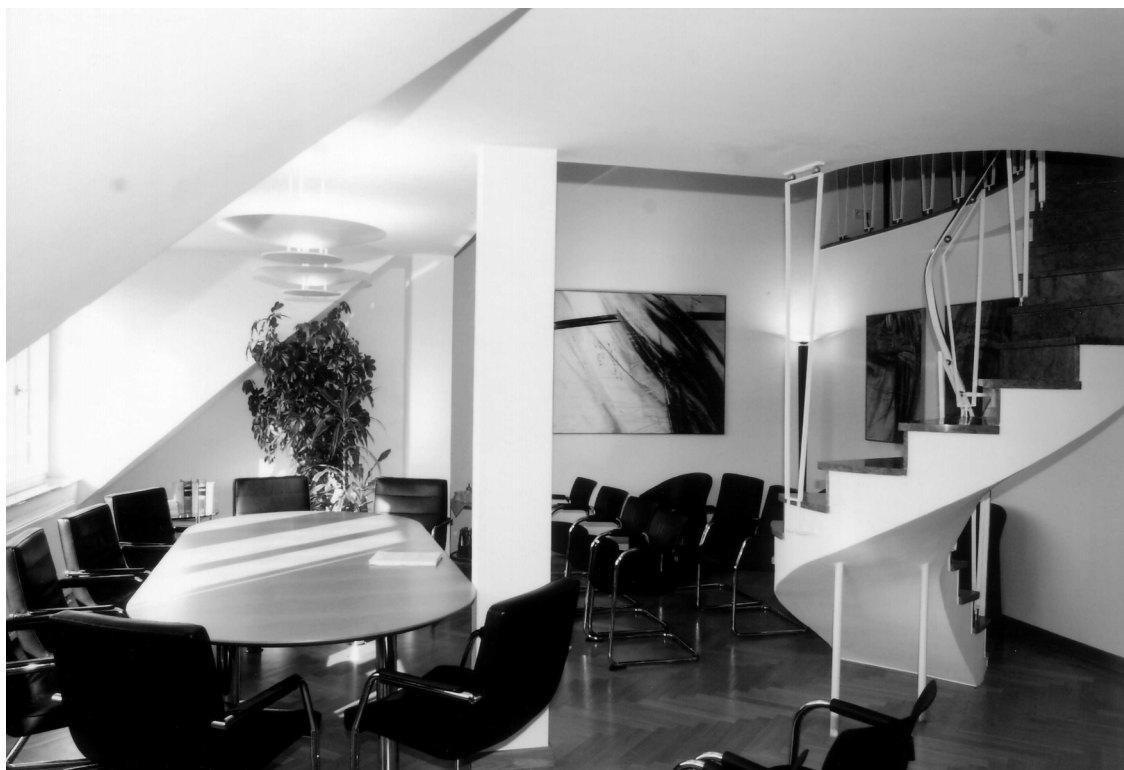
Präsidentenzimmer im Kammergebäude München

Die Rückschau auf die vergangenen 125 Jahre macht jedoch zuversichtlich, dass der Rechtsanwalt als Organ der Rechtspflege und die Kammer München noch eine mindestens ebenso lange Zukunft haben werden.